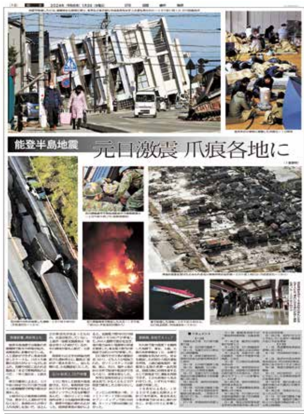
(四国新聞 令和6年1月3日付より引用)