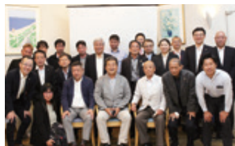
入会5年以内会員オリエンテーション