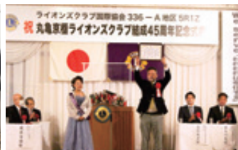
京極ライオンズ結成45周年記念大会