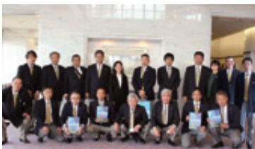
336-A地区第68回年次大会