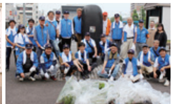
第28回リフレッシュ瀬戸内