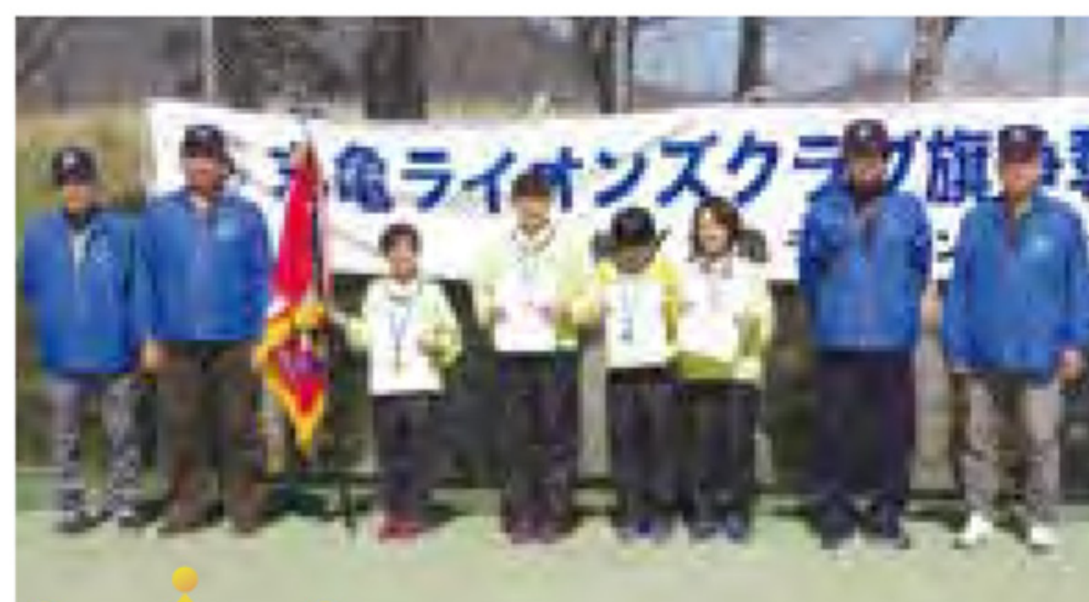
【小学 5.6 年女子】