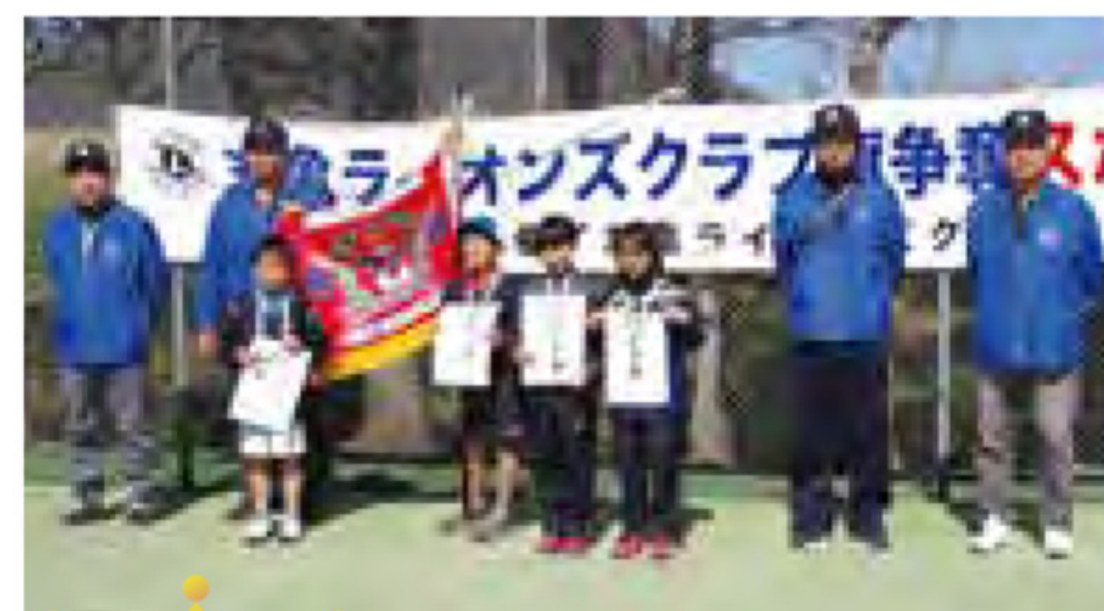
【小学 4 年生以下】