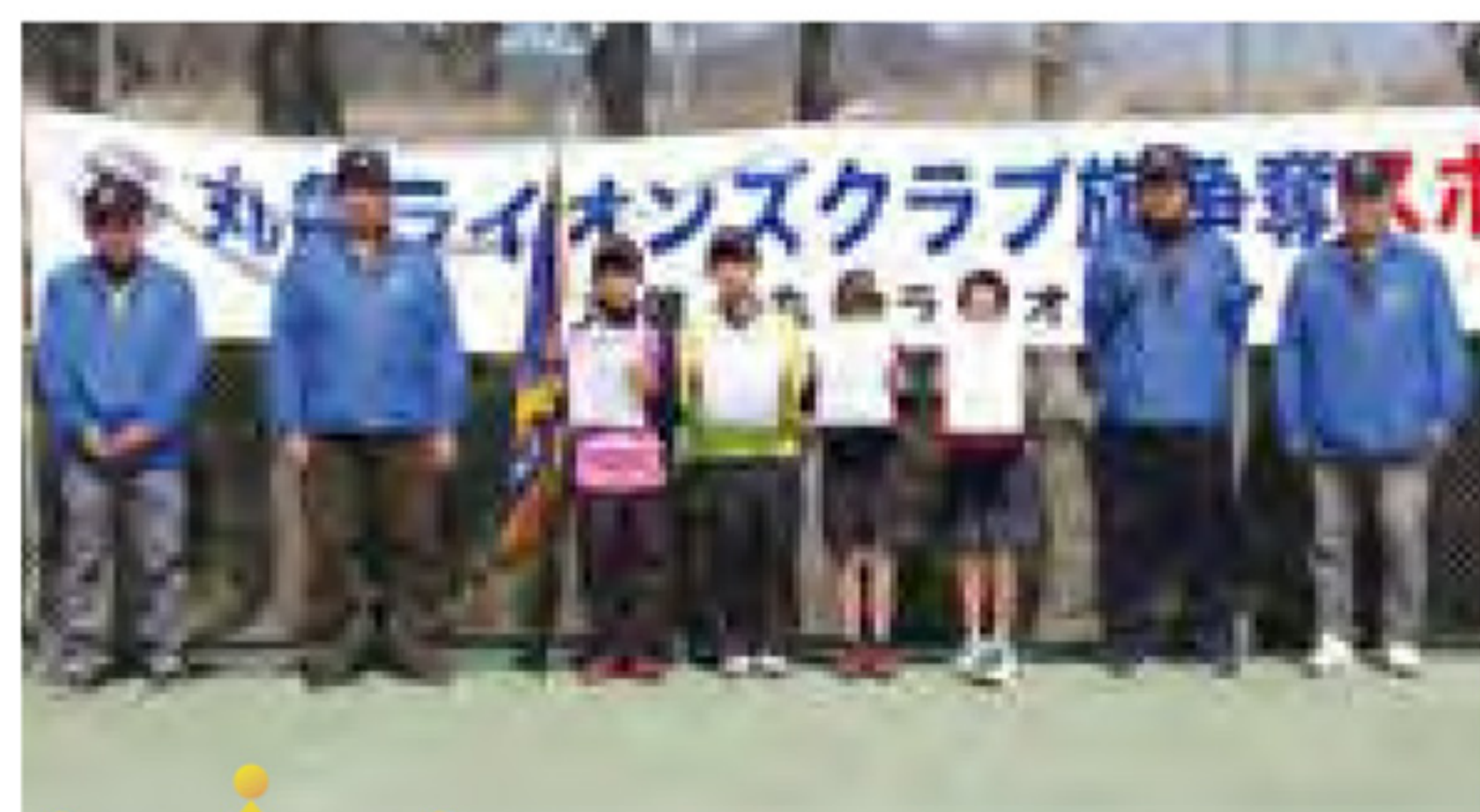
【小学 5.6 年男子】