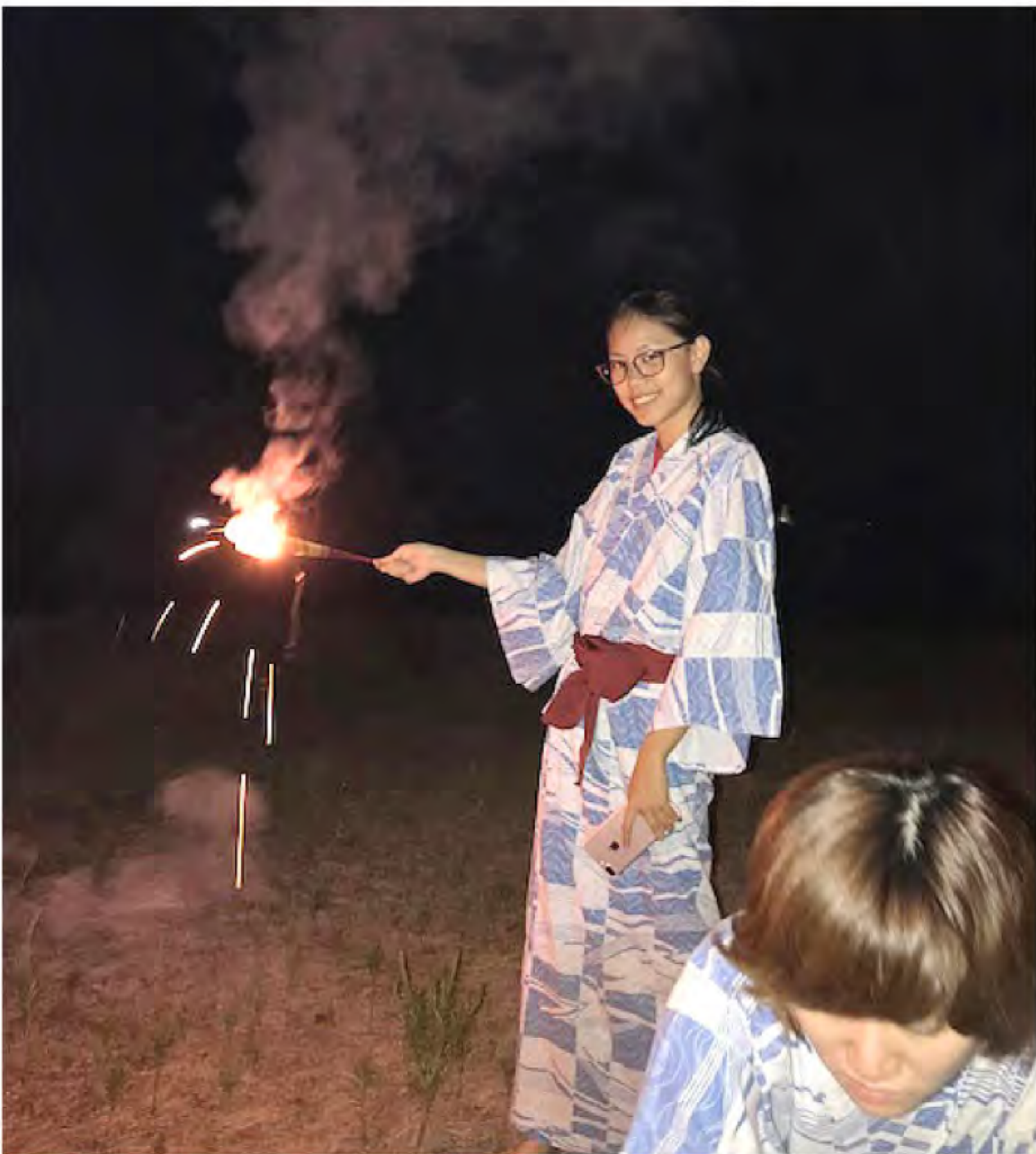
小豆島で花火をしました