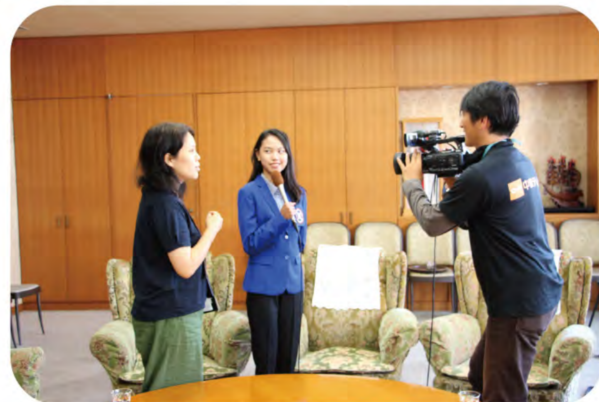
中讃ケーブルの取材風景 8月3日にCVCニュースで放映しました。