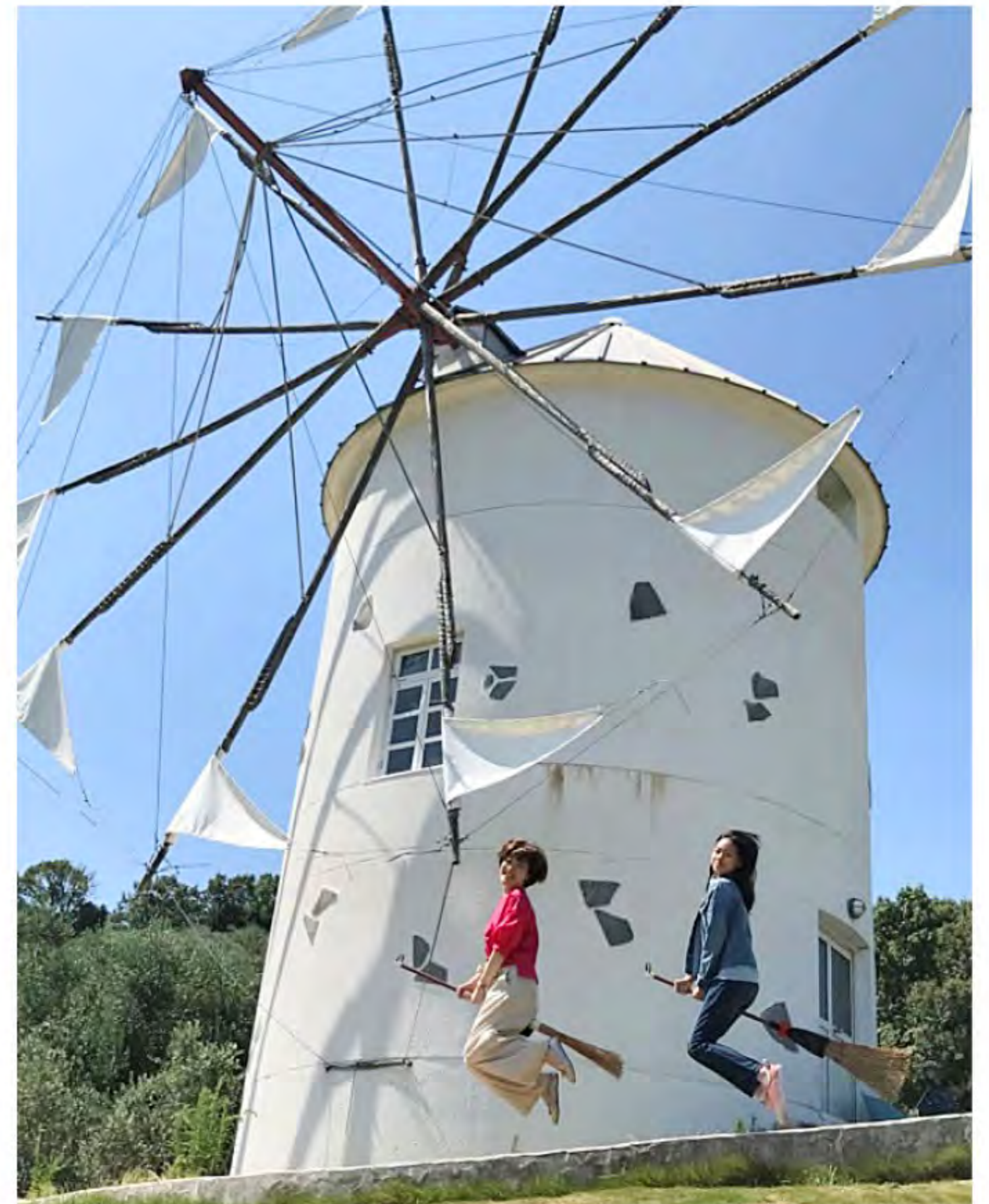
映画「魔女の宅急便」ロケ地 オリーブ公園で主人公になったつもりで