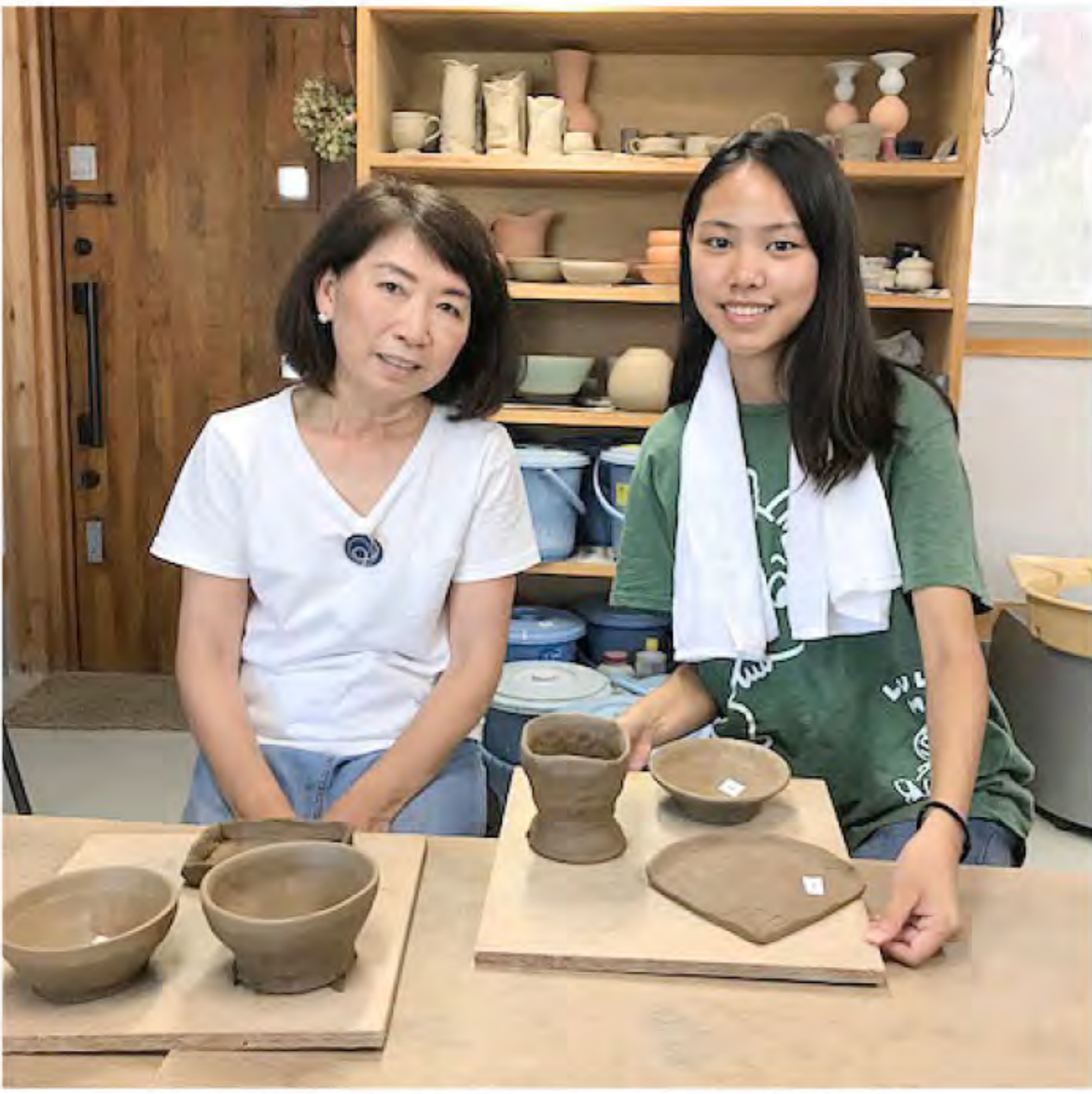
綾歌町[藤見窯]にて陶芸体験