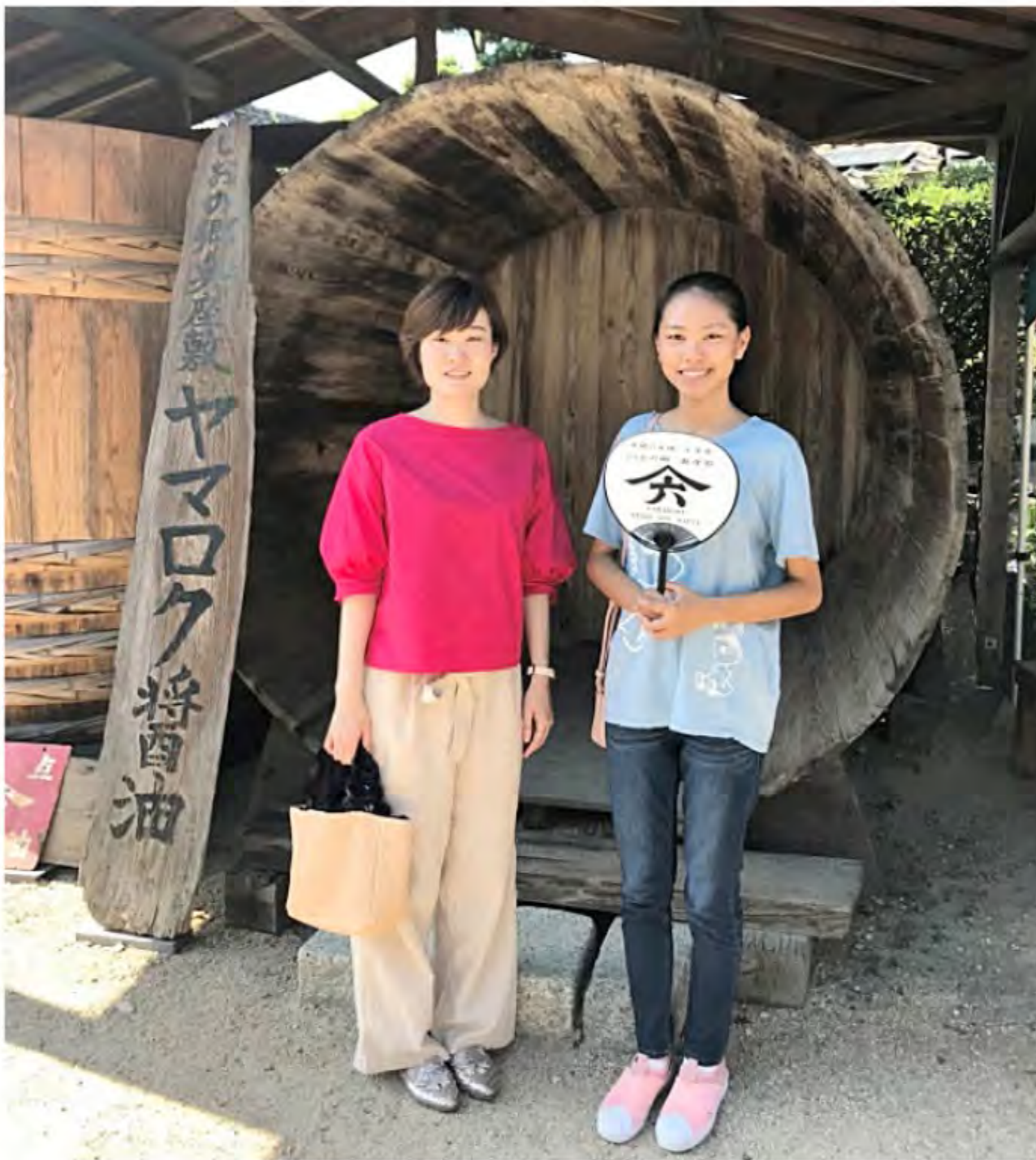
小豆島の醤油醸造蔵元にて