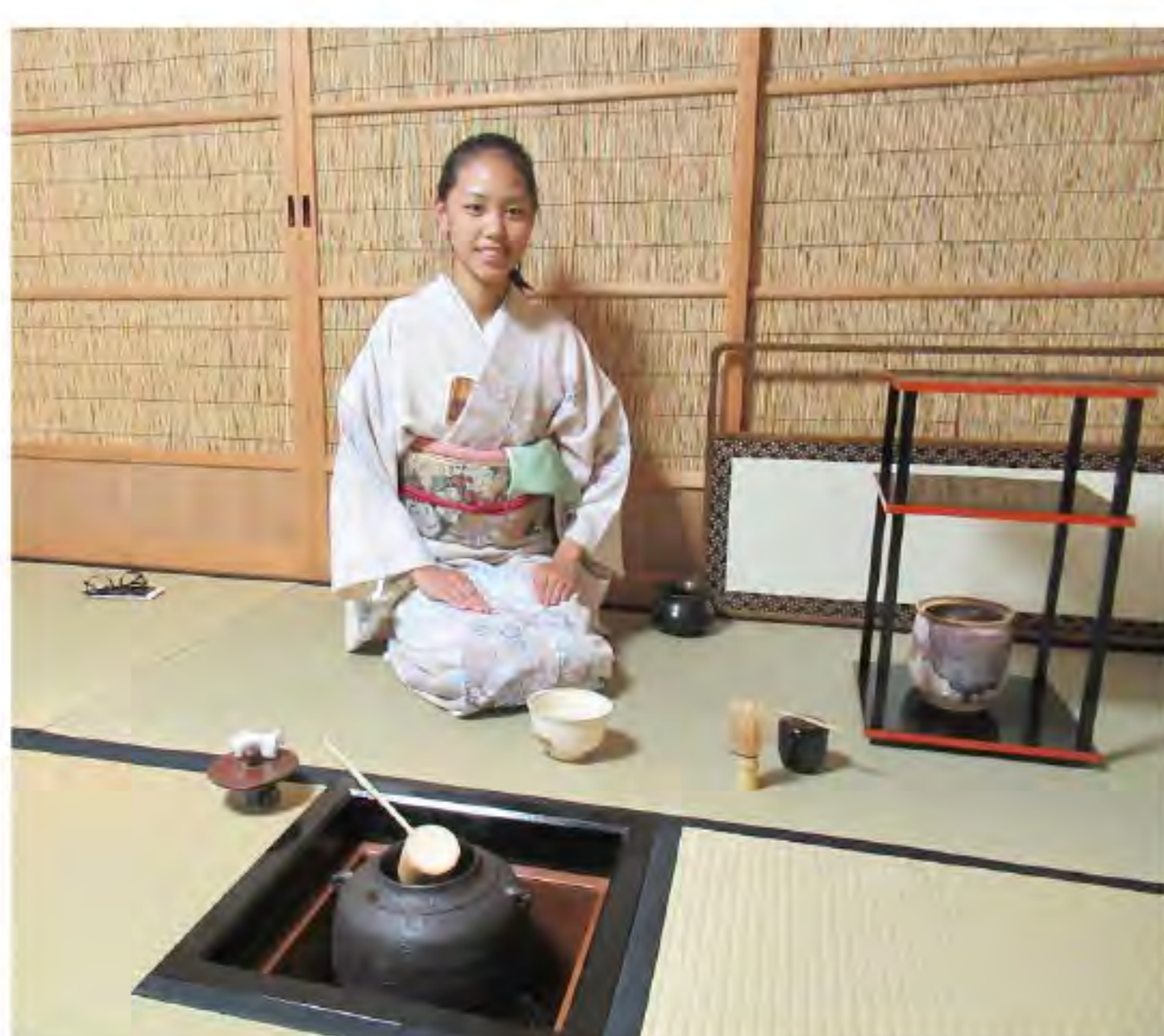
高橋会長婦人指導でお茶を点てました