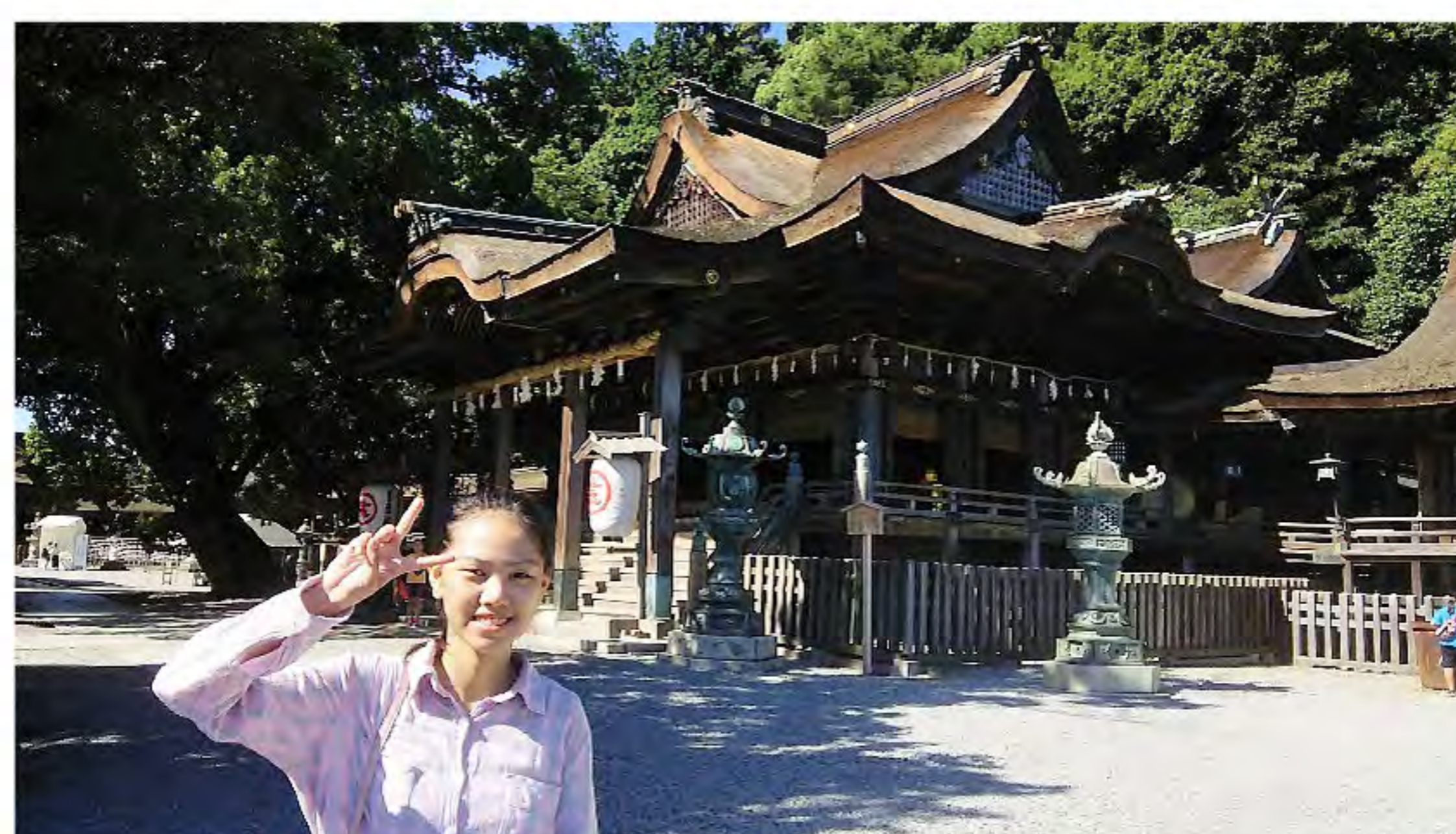
こんぴらさん「I'm very young」と笑顔で本殿まで