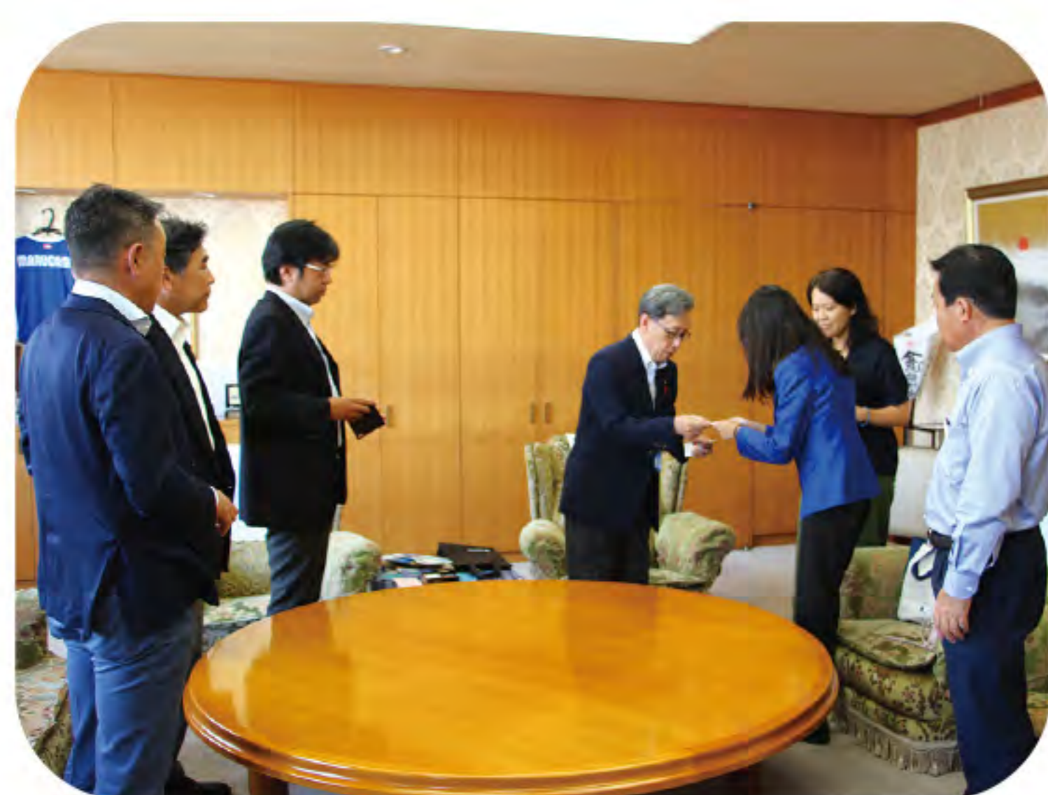
丸亀市と台湾の 交流が開花しました。