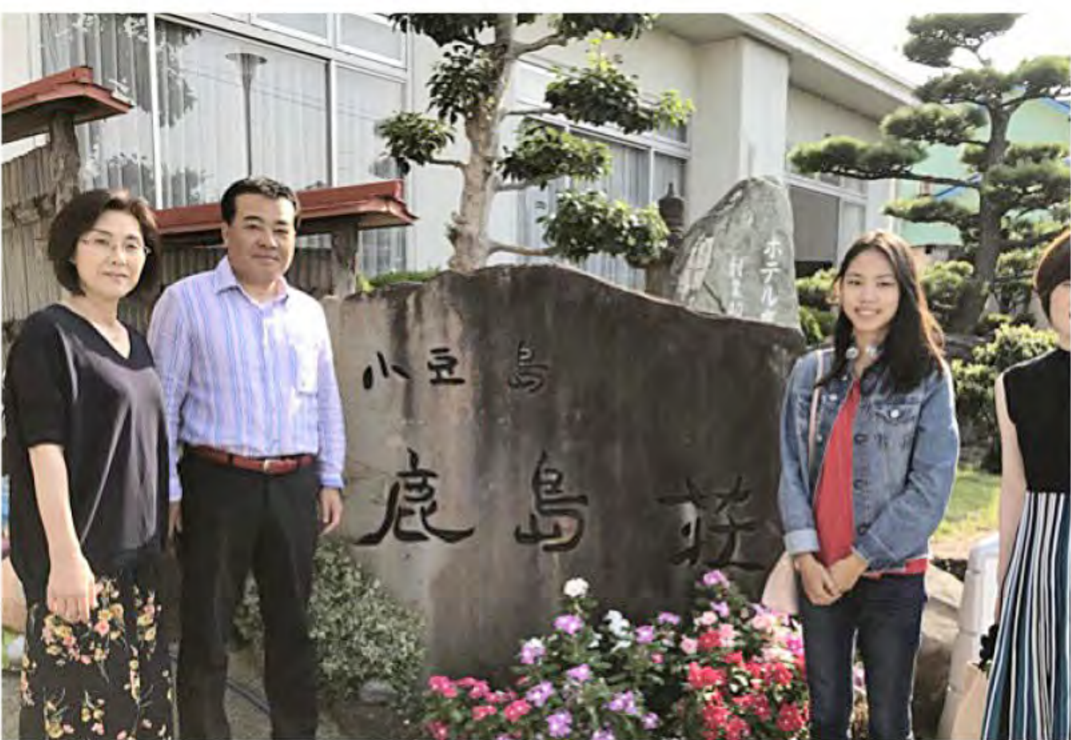
小豆島 鹿島荘にて宿泊

笑顔が素敵な可愛いYCE生でした。特に日本の文化に触れることが好きようで、綾歌町の「藤見窯」での陶芸体験は楽しそうに取り組んでいました。