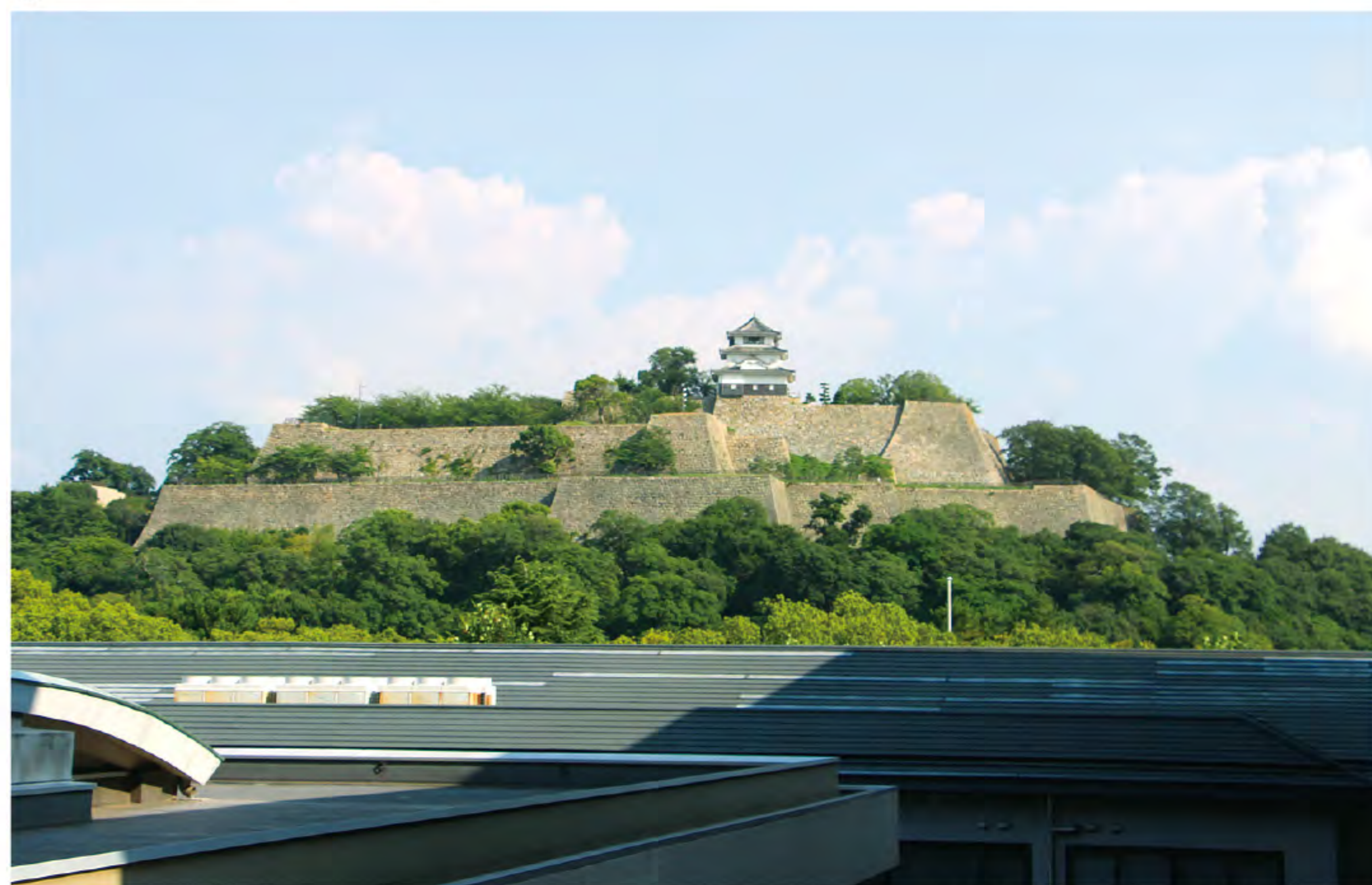
市役所より丸亀城展望