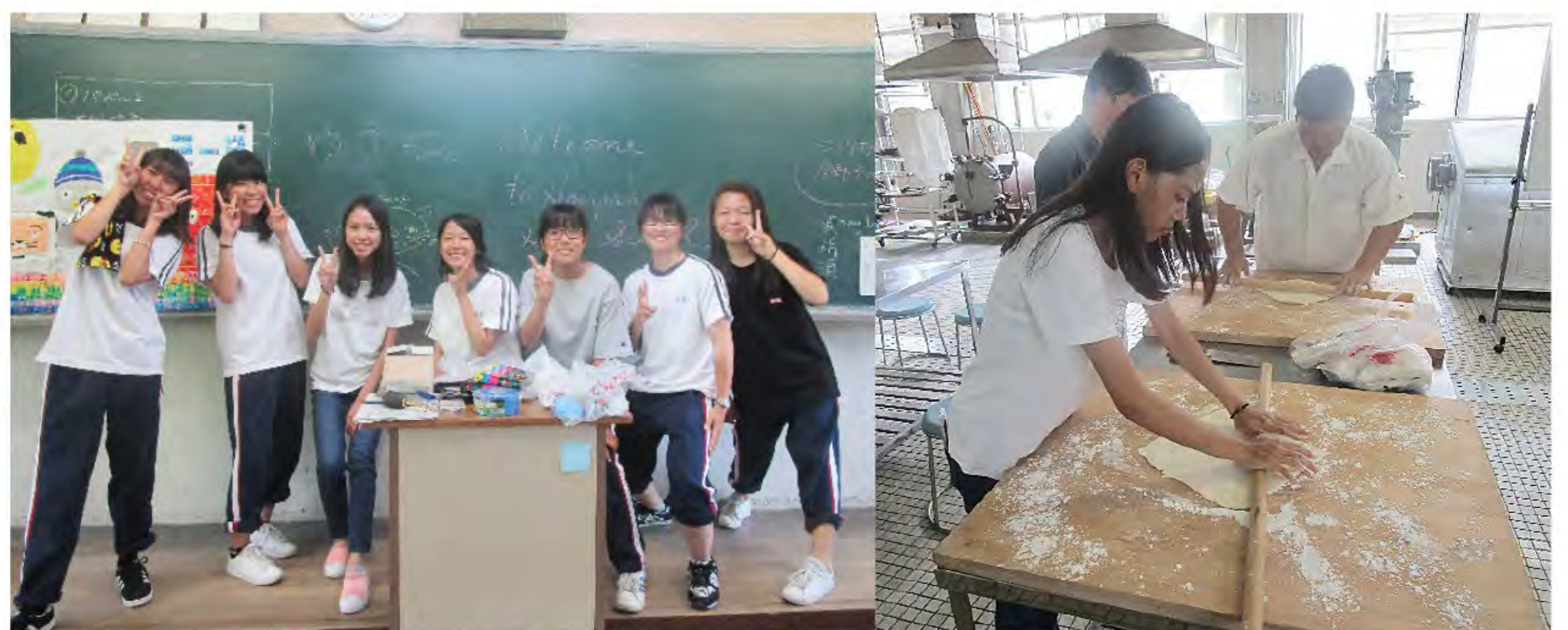
7/27 飯山高校訪問 うどん作り