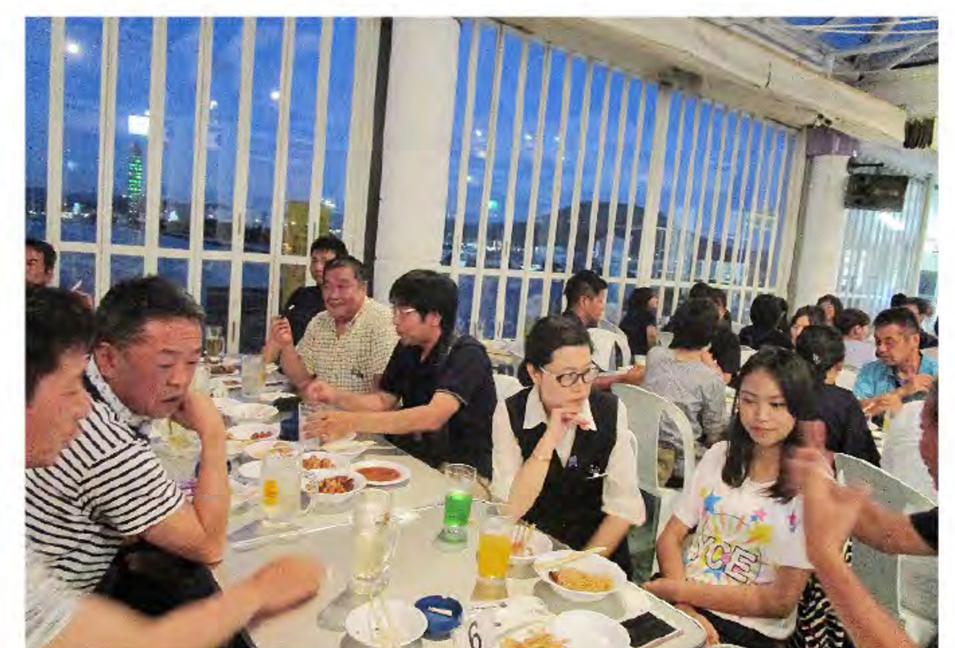
7/20 歓迎会 ビアガーデン

一番の思い出は「こんぴらさん」に登った事です。猛暑の中、あの階段を登る事を阻止しようと何度も「止めようよ」と言いましたが、その度に彼女は「I'm very young!」と笑顔で答え、とうとう登らされた事です。