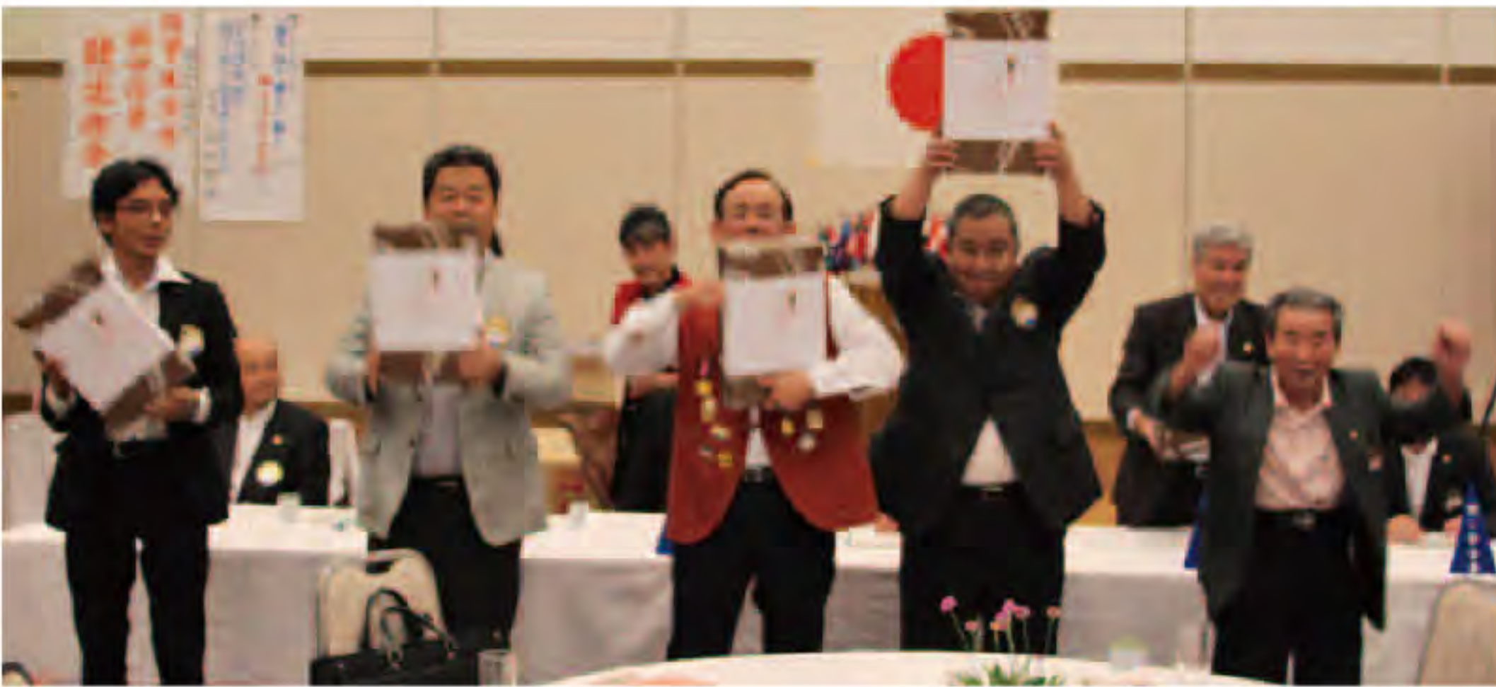
例会皆勤賞 5名のメンバー