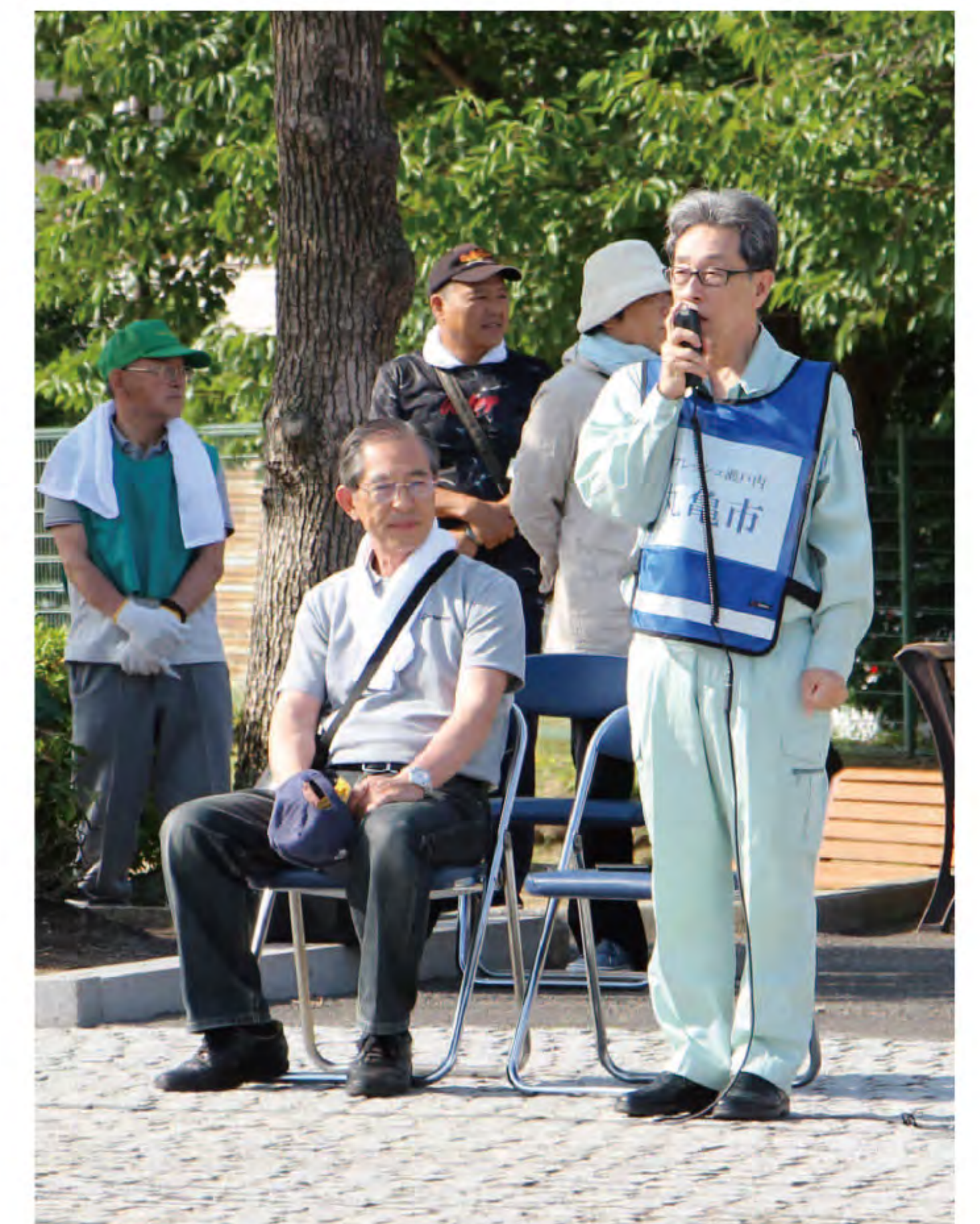
丸亀市長よりごあいさつ