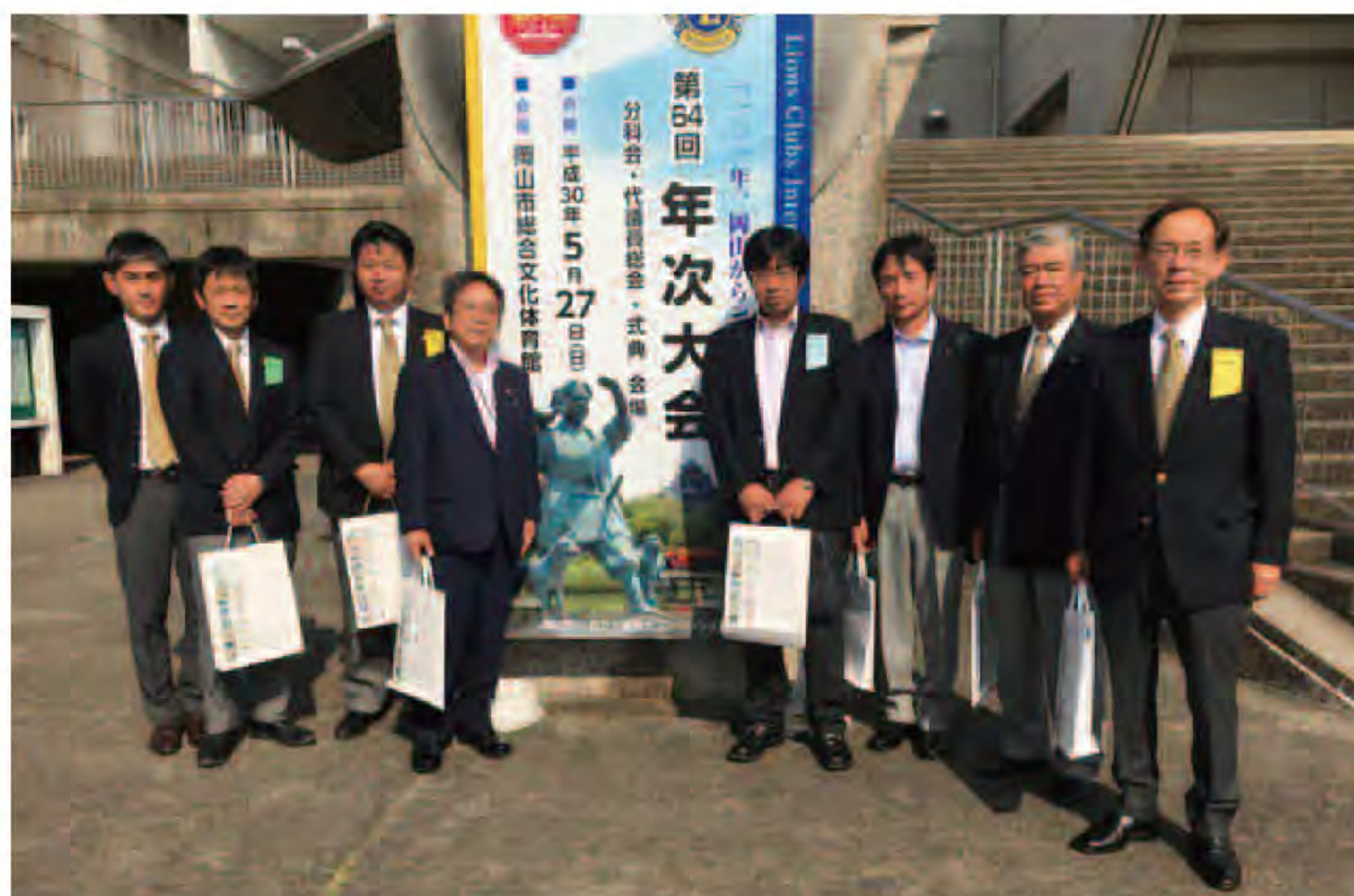
丸亀LCより9名が代議員で出席しました

また、終わりにりましたが、本大会の関係役員の方々並びにホストクラブメンバー各位、事務局員の皆様に心よりお礼申し上げます。ライオンズクラブ国際協会336複合地区内のクラブ発展と会員の皆様のご健勝を祈念して私のご挨拶とさせていただきます。