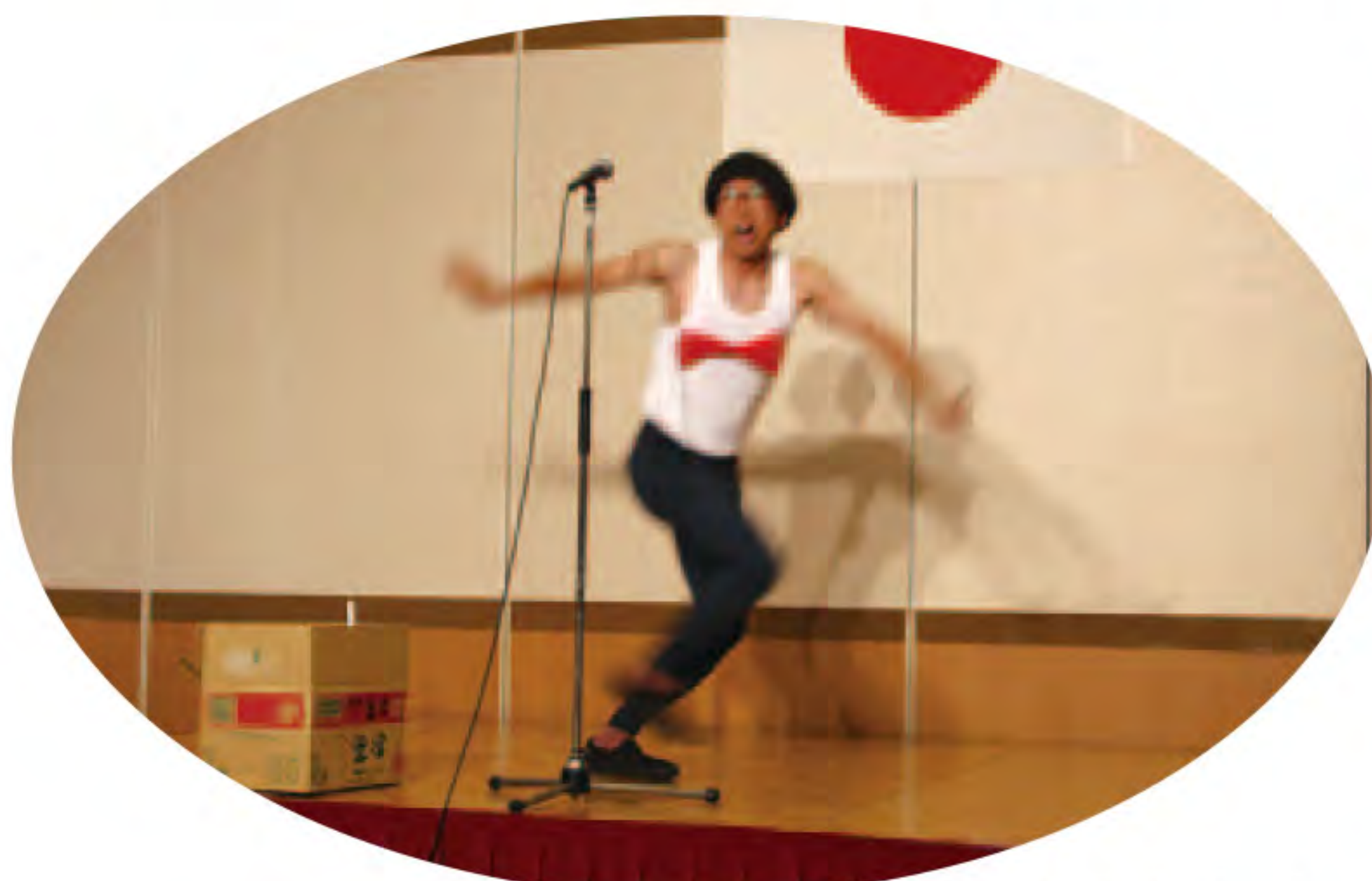
丸亀城人力車芸人のライブ