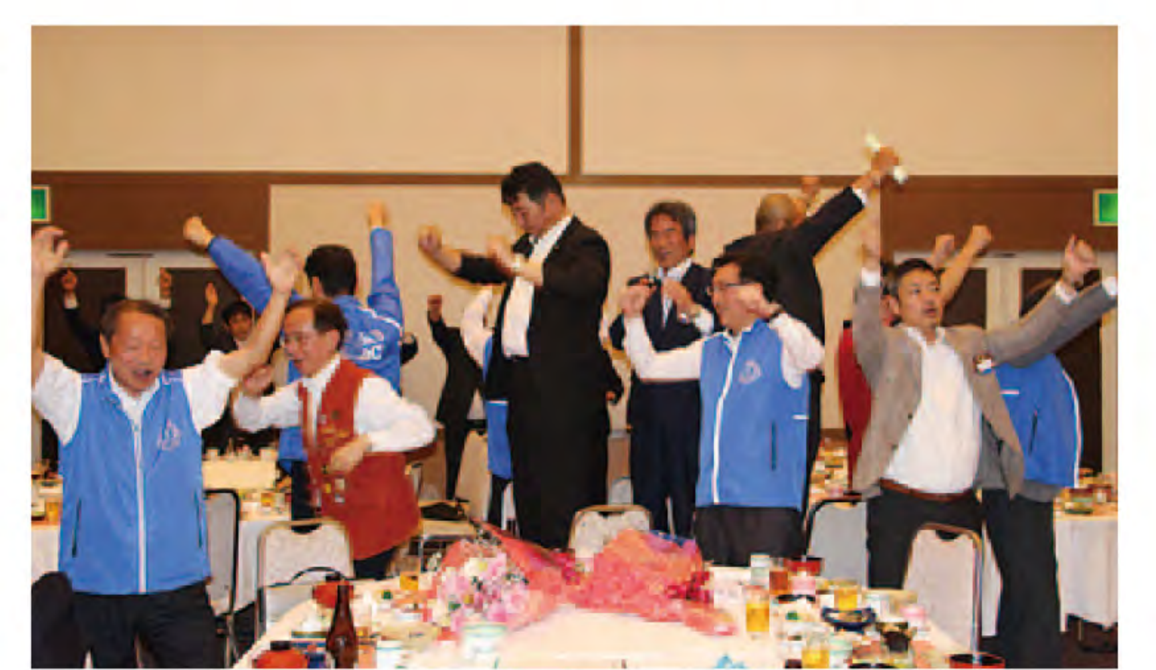
盛大に開催しました。