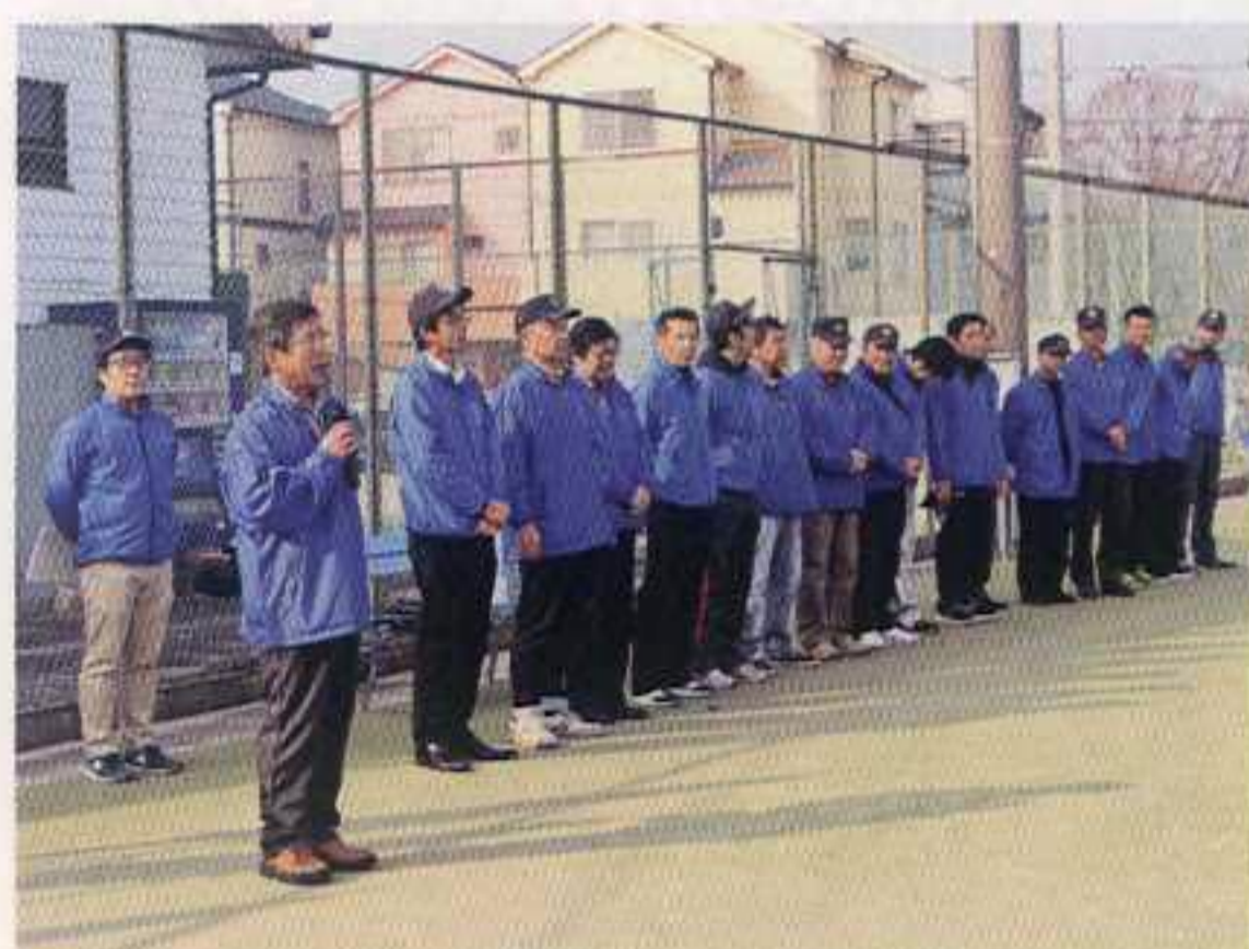
会長L田中より開会のあいさつ