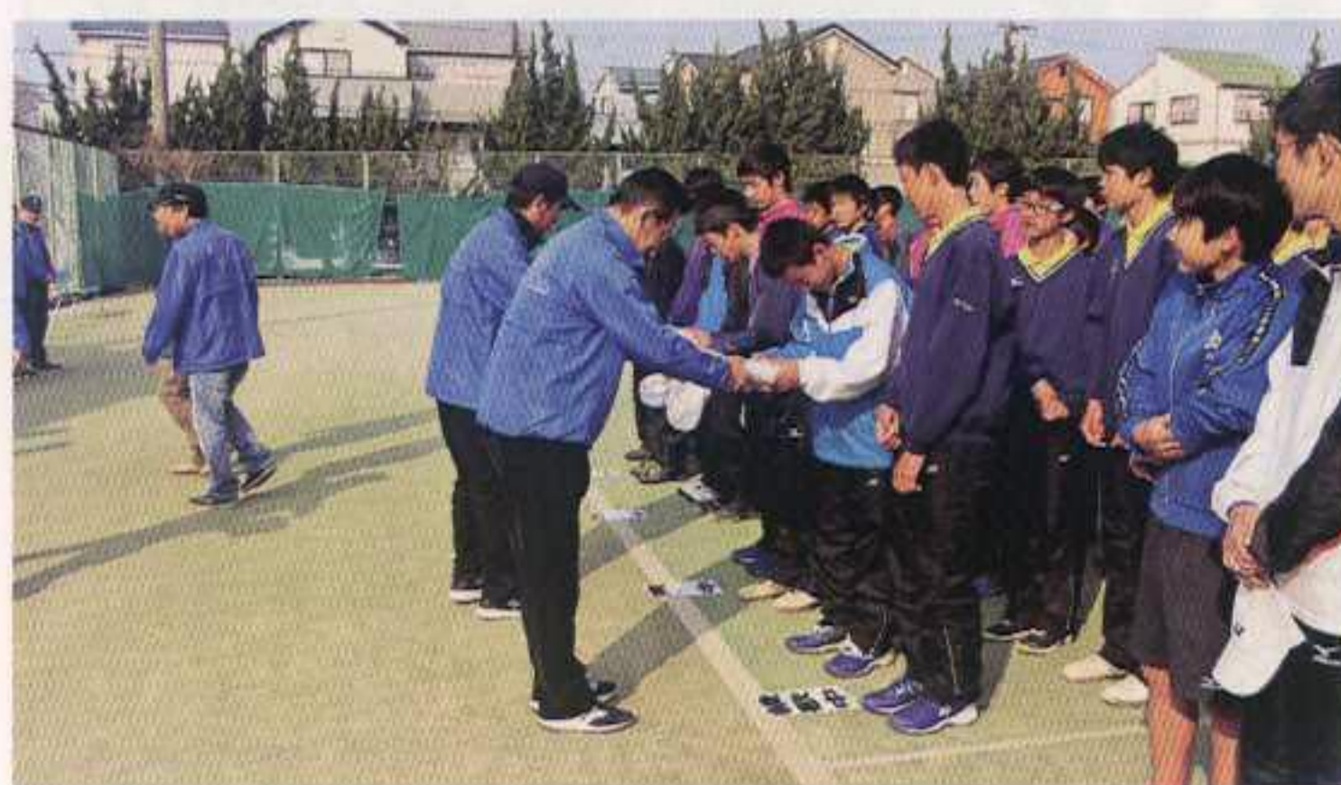
参加賞贈呈(テニスボール)