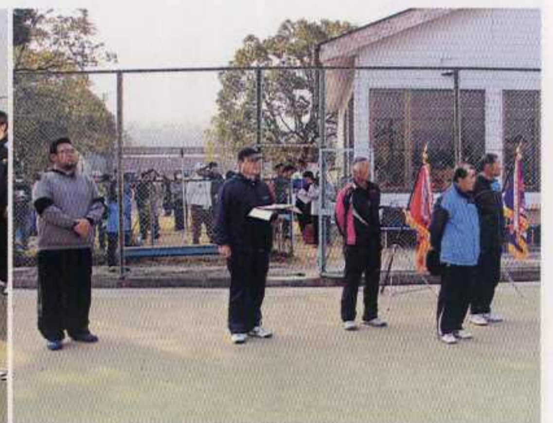
大会関係者の皆様