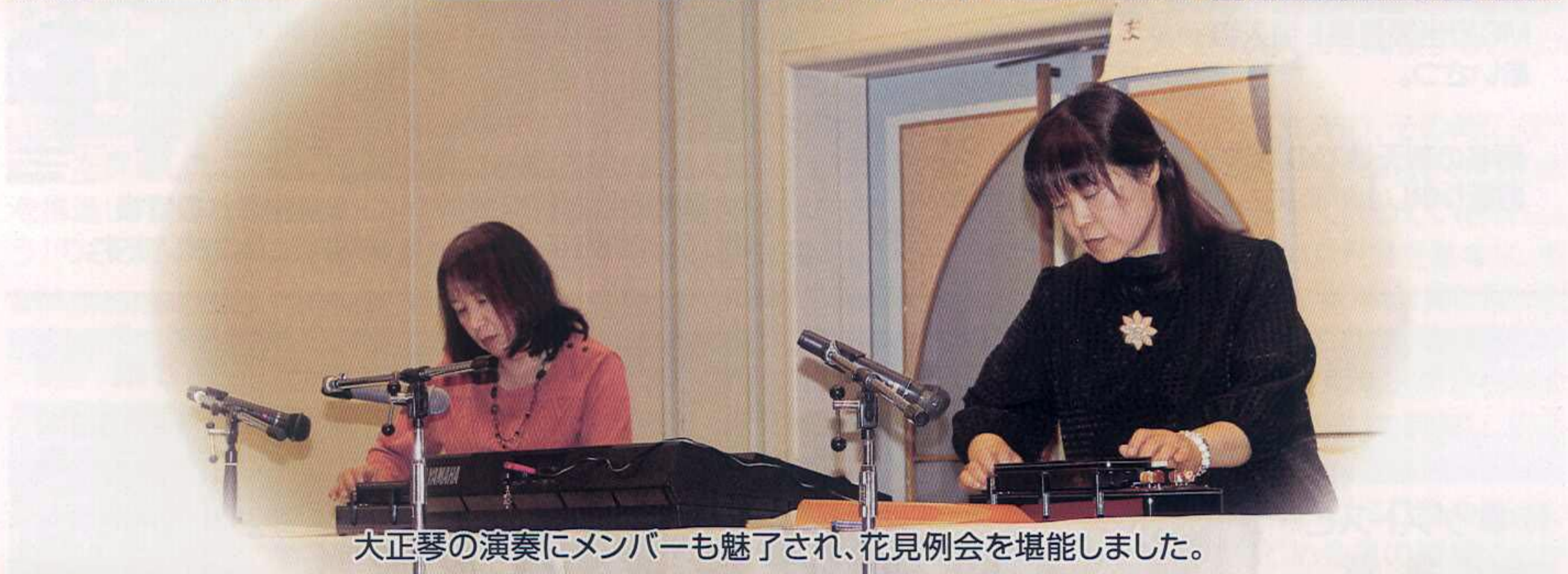
大正琴の演奏にメンバーも魅了され、花見例会を堪能しました。