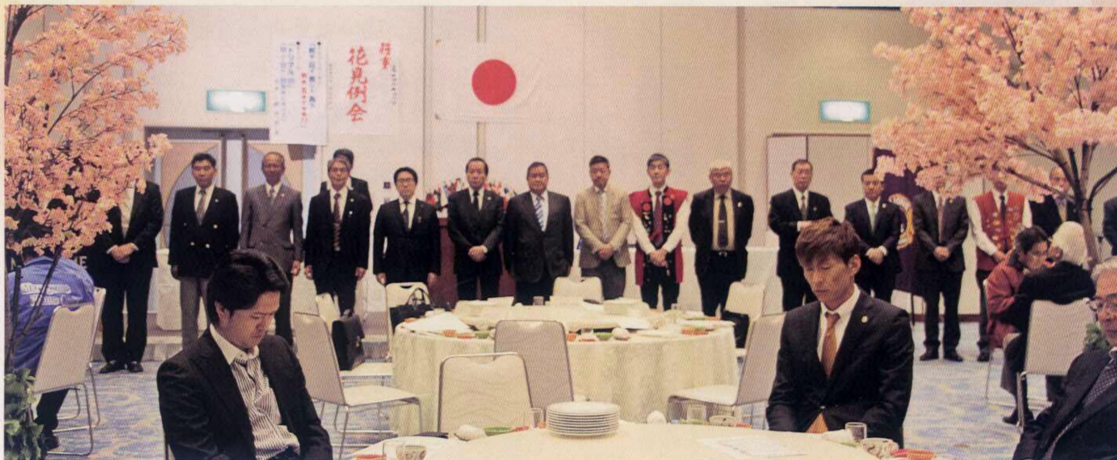
次年度役員お披露目