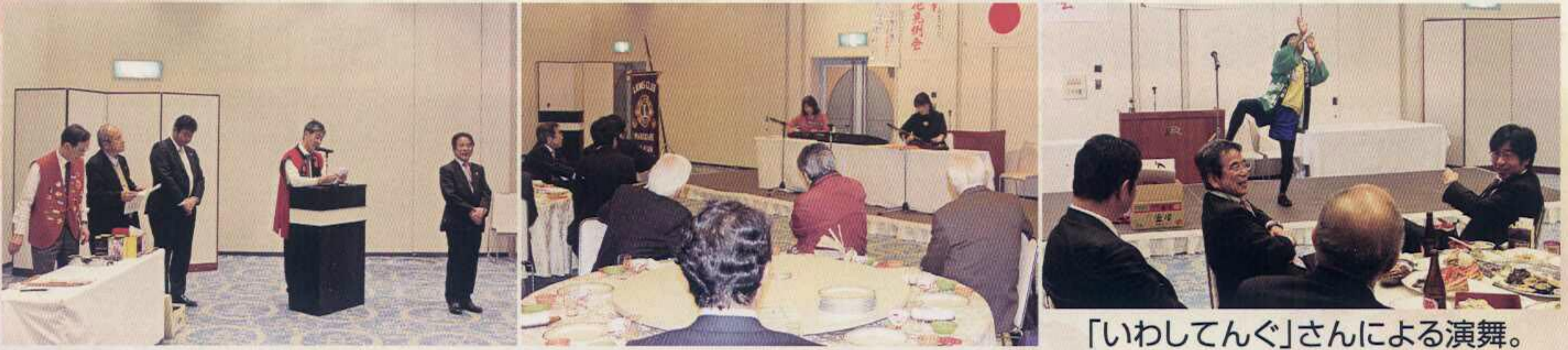
「いわしてんぐ」さんによる演舞。