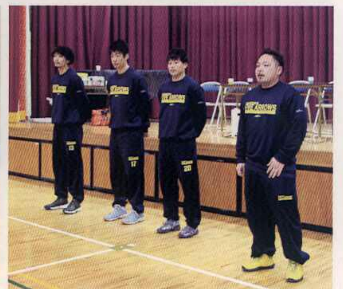
香川ファイブアローズの選手