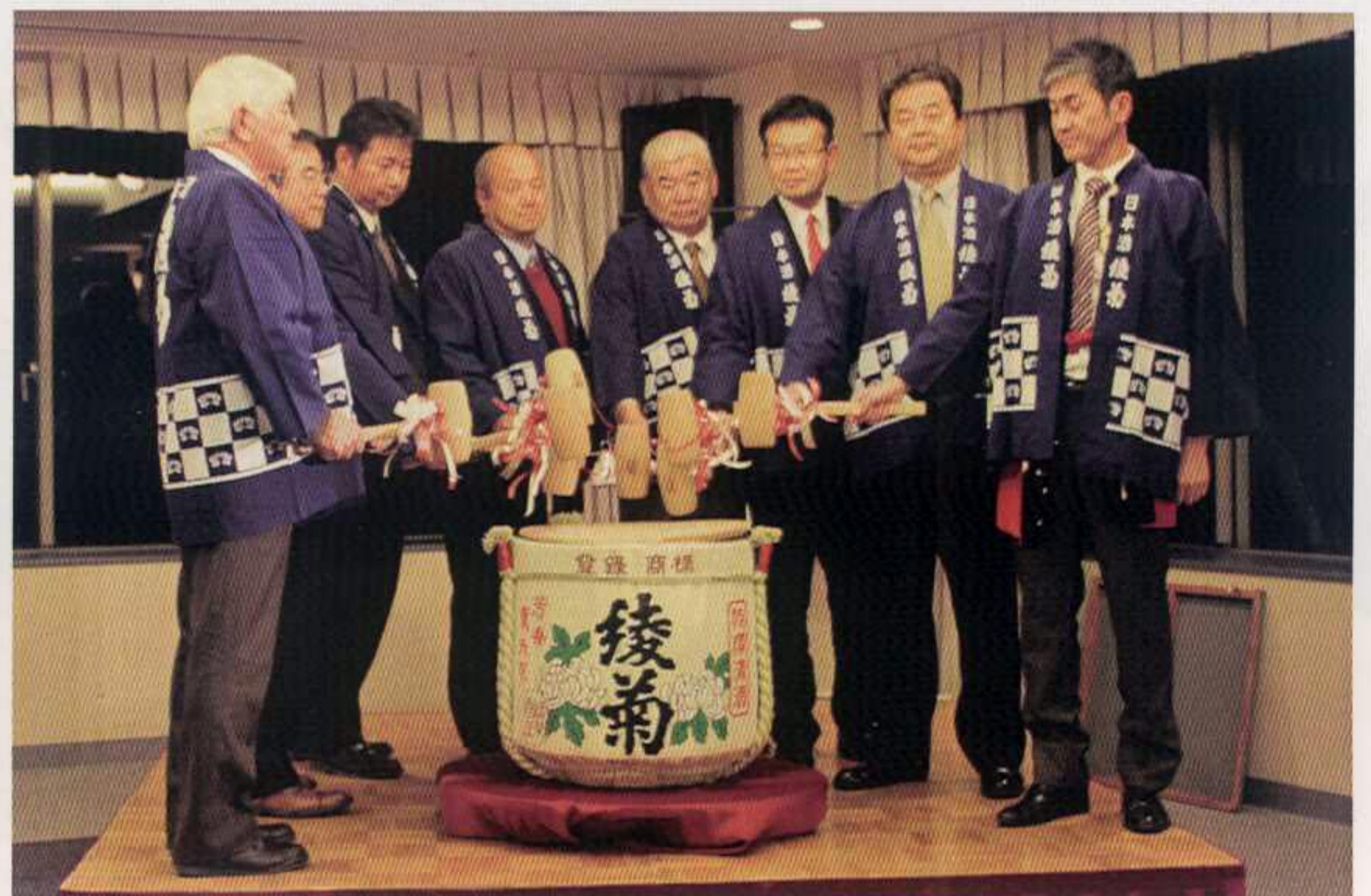
鏡開きで今年もウィ・サーブ!