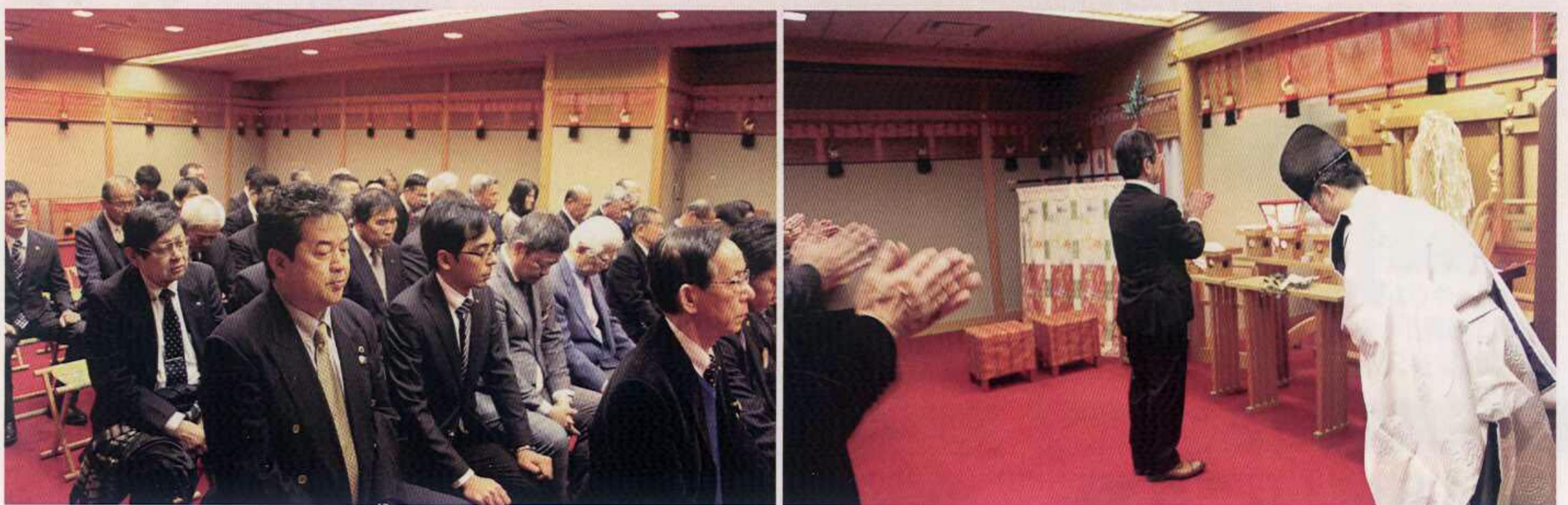
メンバー全員で祈願