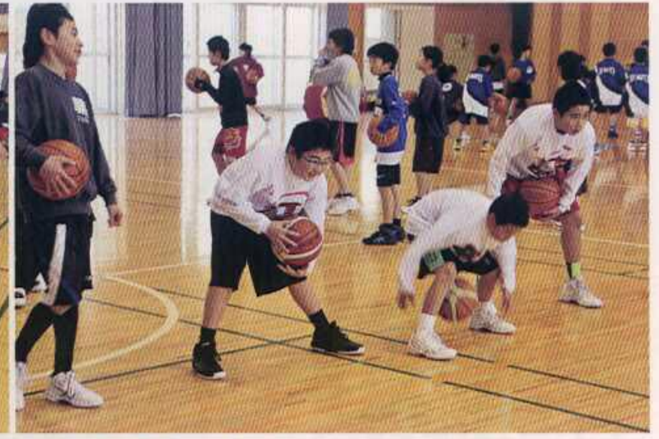
しっかり練習。その後ミニゲームへ