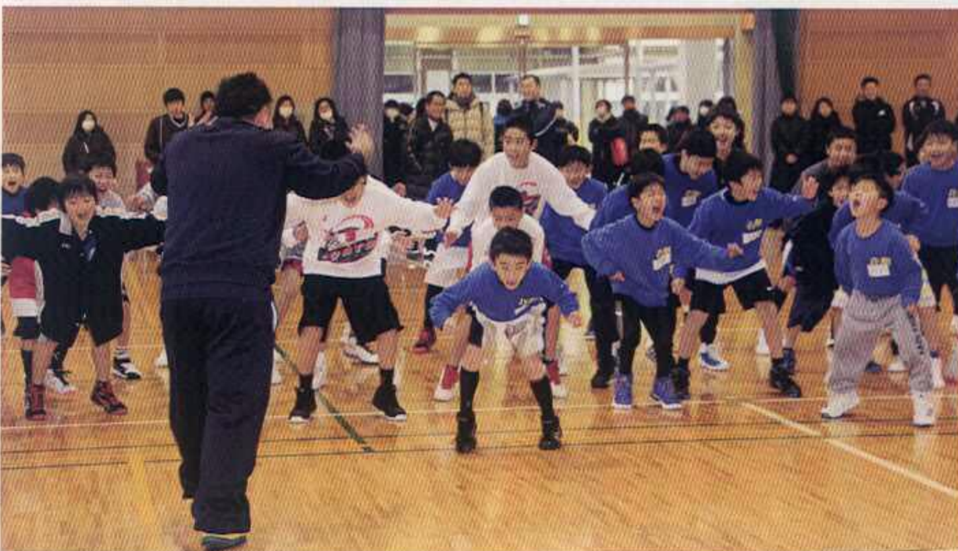
大きな声で準備体操