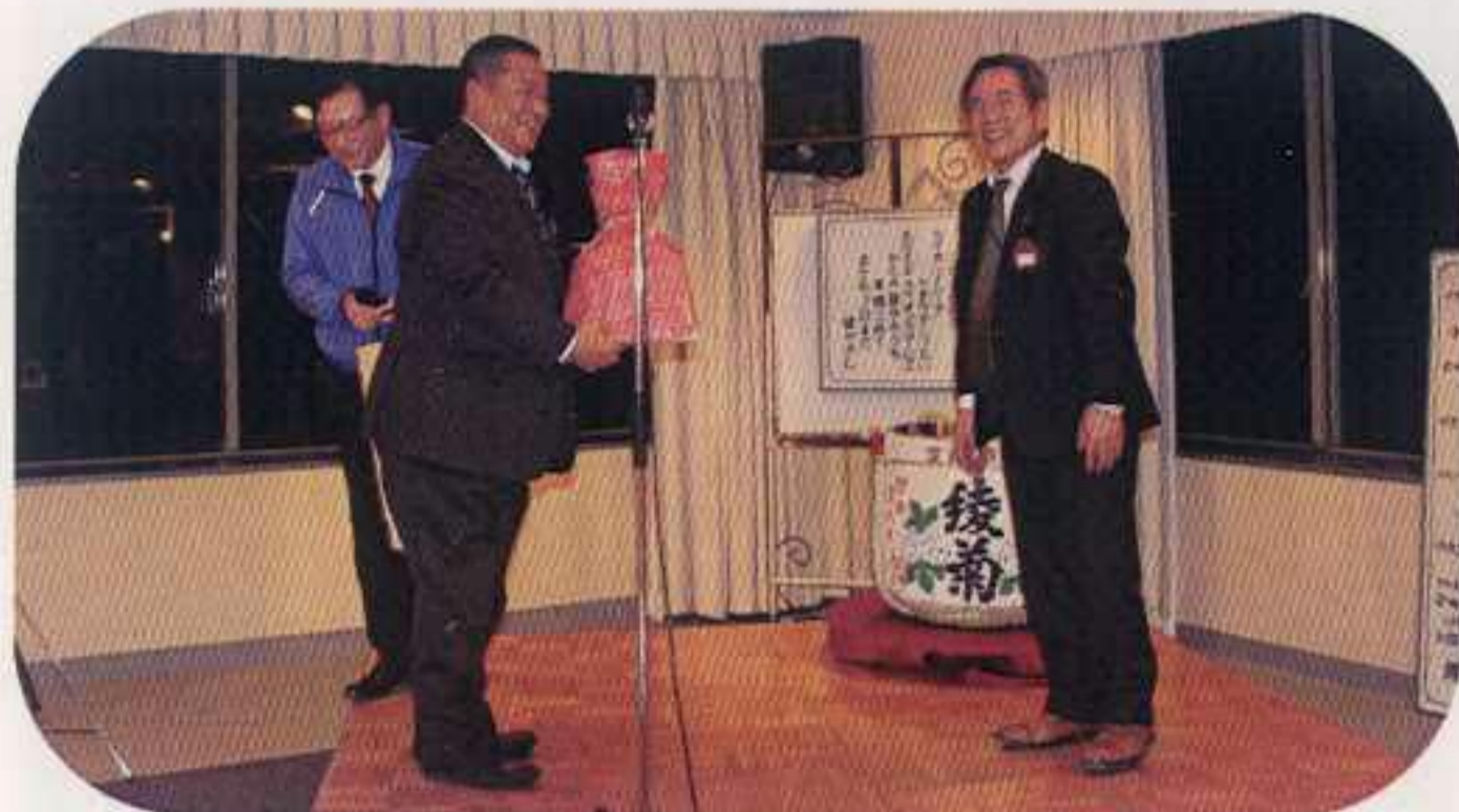
楽しいゲームで盛り上がりました