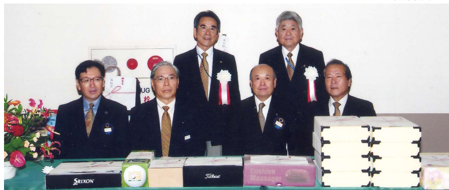
ゴルフ部会のメンバー