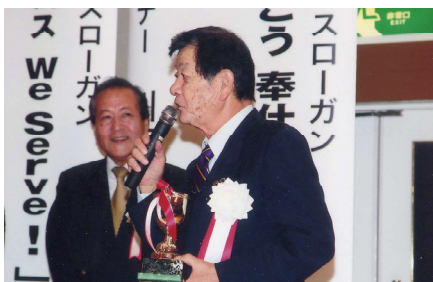
優勝者のスピーチ

前夜祭で姉妹クラブ・友好クラブのメンバーとの歓迎会をし、祝宴中頃にはゴルフ大会表彰式で優勝者にスピーチをいただき盛り上がりました。