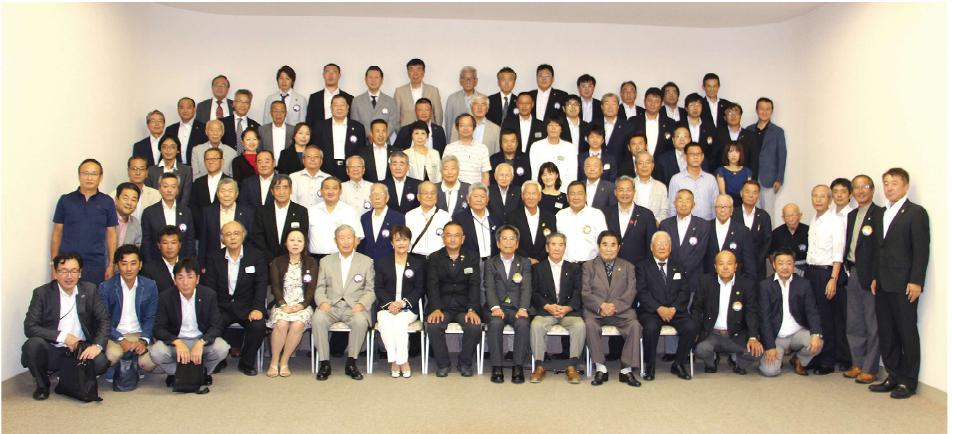
合同例会出席者のメンバー