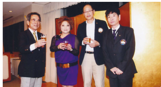
前夜祭のひとつとき