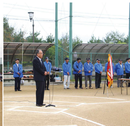
教育長 金丸眞明様よりごあいさつ