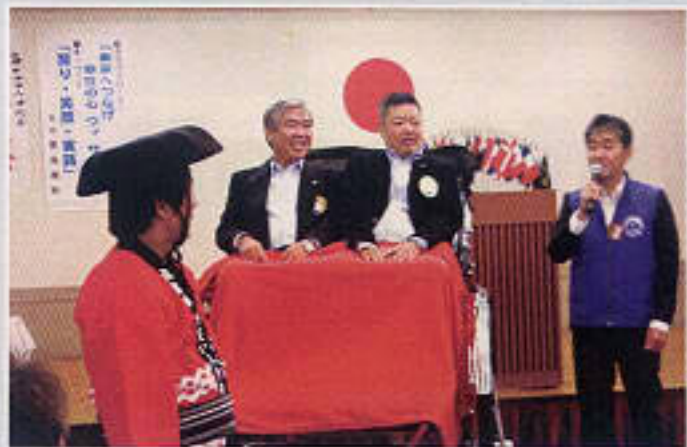
住みます人力車芸人により兩名登場!!