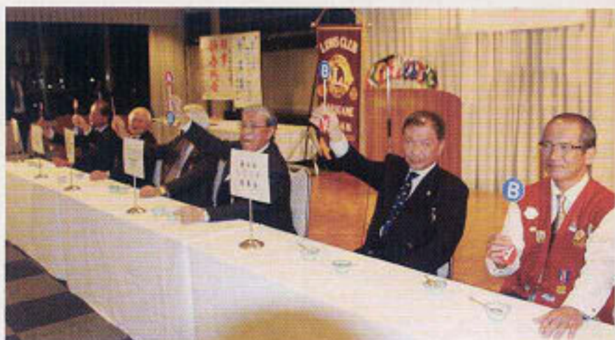
食べ比べゲームで真剣に楽しく競いました。