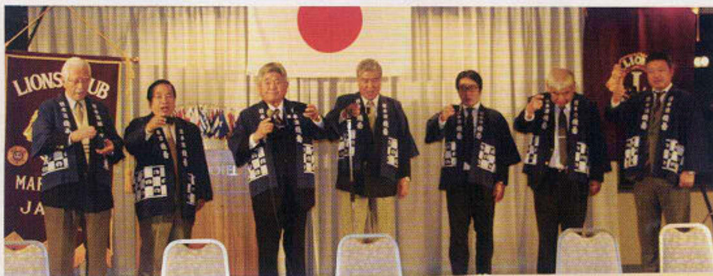
年男と役員鏡開きで祝宴の始まり。