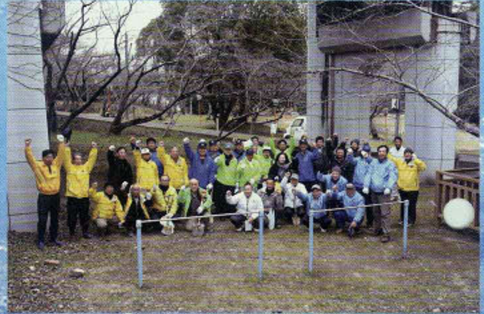
5R1Z合同アクティビティ