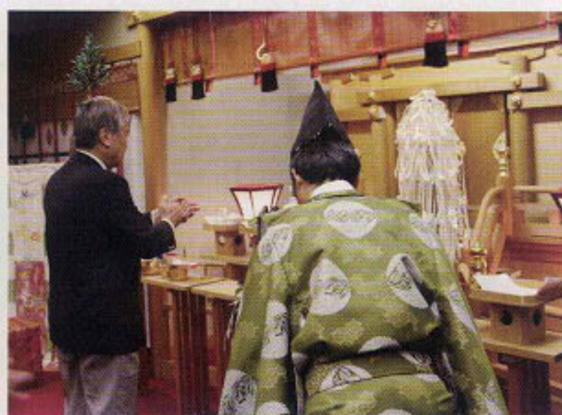
創立60周年の成功も祈願しました。