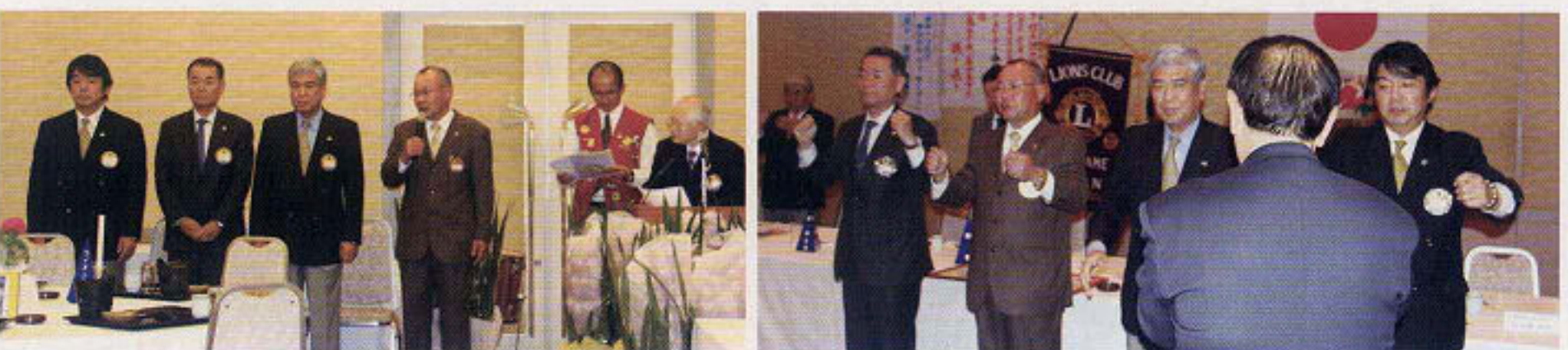
L岡本には、PR委員会、L新居には、YCE・国際関係委員会で活躍していただきます。