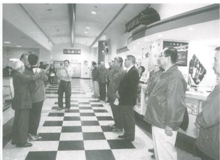
宣誓! ガンバります。