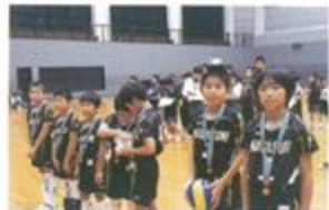
長炭バレーボールクラブ男子