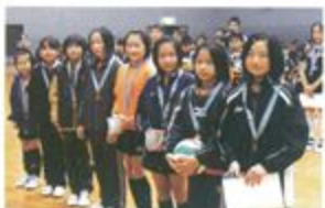
郡家バレーボールスポーツ少年団