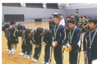
四箇バレーボールスポーツ少年団