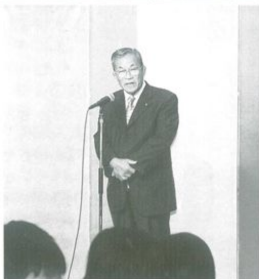
新井市長から祝辞