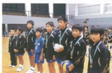
飯山ジュニア男子バレーボールクラブ