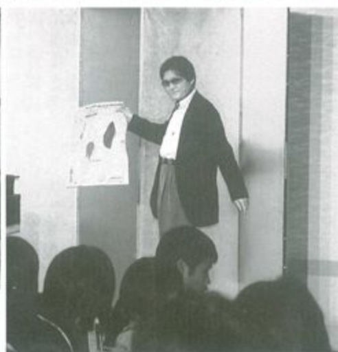
L横関のマジックショー