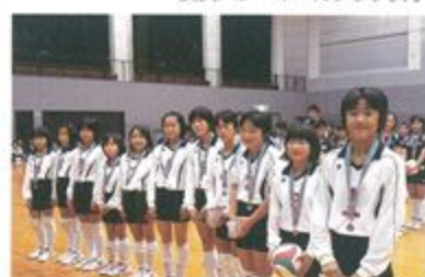
坂出ジュニアバレーボールスポーツ少年団