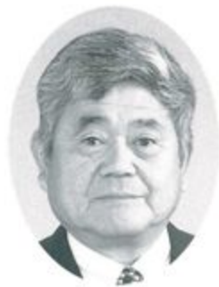
丸亀ライオンズクラブ