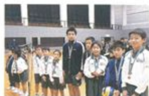
丸亀南Try Kidsバレーボールクラブ