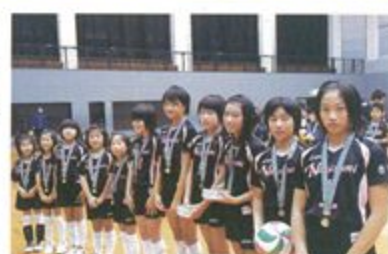
長炭バレーボールクラブ女子