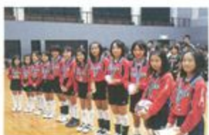
チーム城辰ジュニアバレー