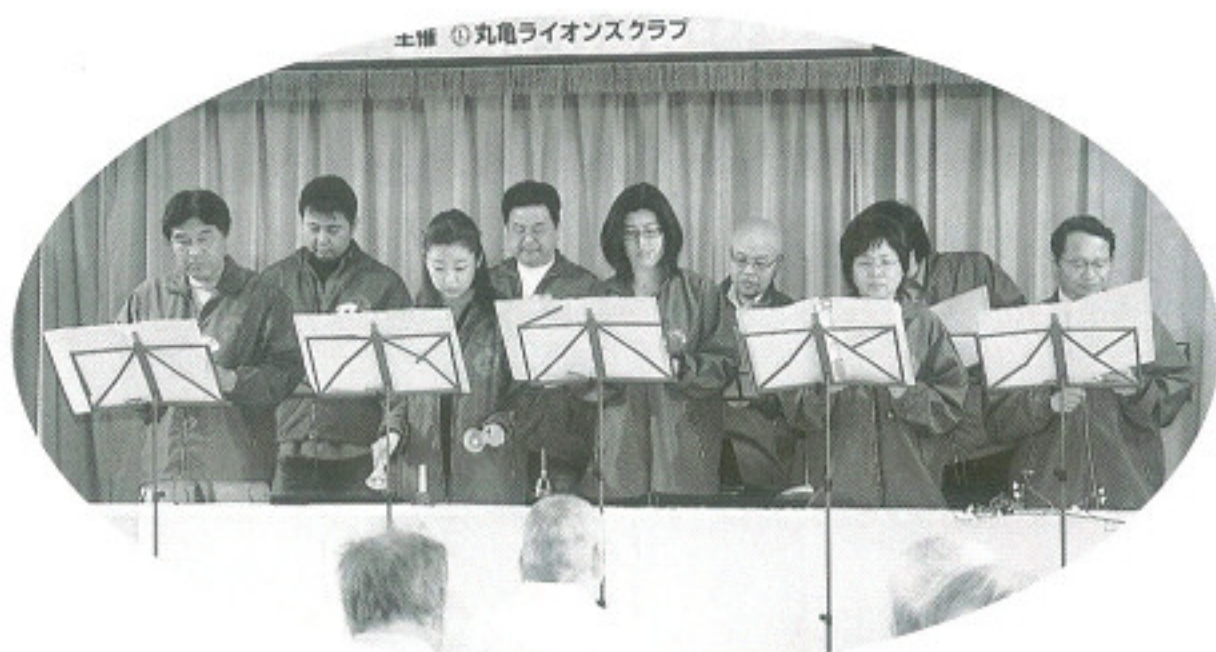
ハンドベル同好会による演奏