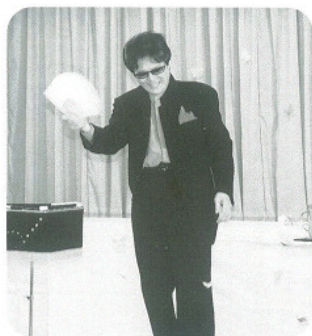
L横関のマジックショー