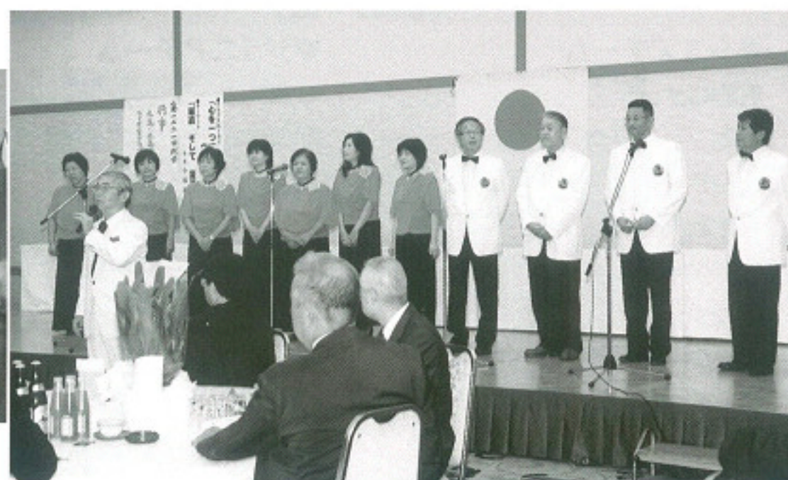
京極LC 恒例のコールライオン合唱