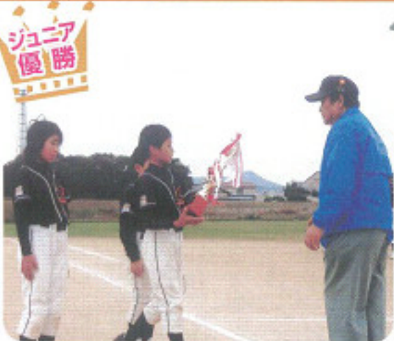
郡家軟式野球スポーツ少年団