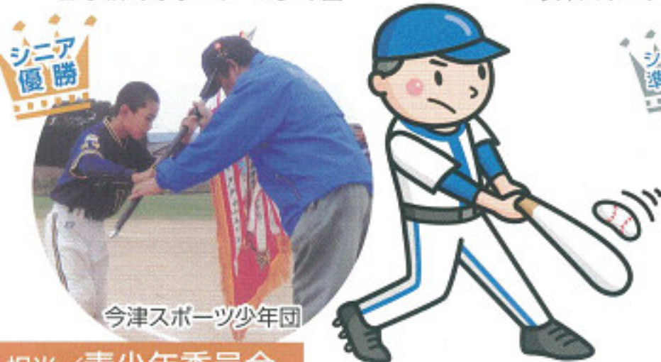
今津スポーツ少年団