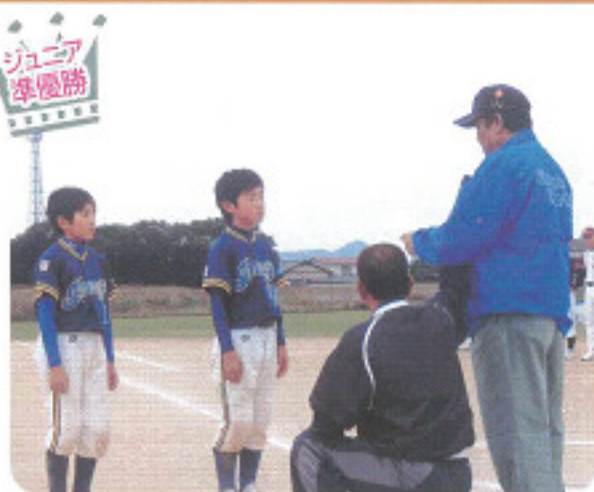
今津スポーツ少年団