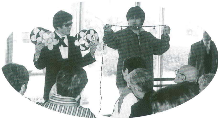
L横関のマジックショー