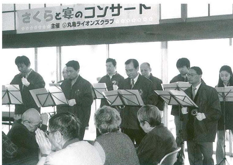
ハンドベル同好会による演奏